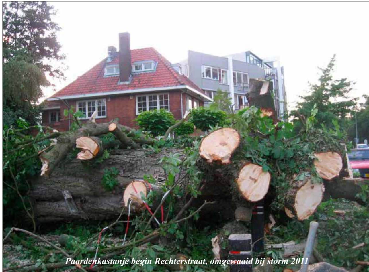
Paardenkastanje begin Rechterstraat, omgewaaid bij storm 2011

Afgelopen jaar is er extra aandacht besteed aan de 'dikste eik van Boxtel' in Sparrenrijk, die we als WNLB graag extra in the picture willen brengen als 'ambassadeur' van bovengenoemd streven.