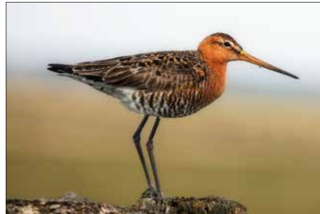
In Boxtel verdwenen (grutto, boven) en verdwijnende weidevogels (kievit, onder).